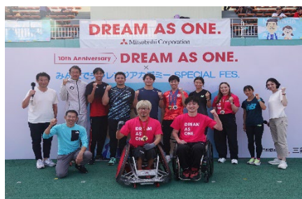
大井ふ頭中央海浜公園陸上競技場 (参加者820名)