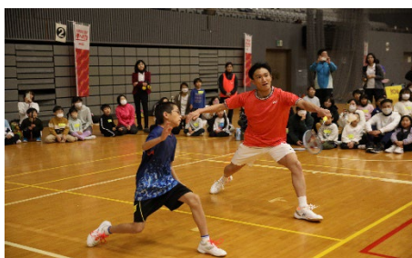
小田原アリーナ (参加者352名)