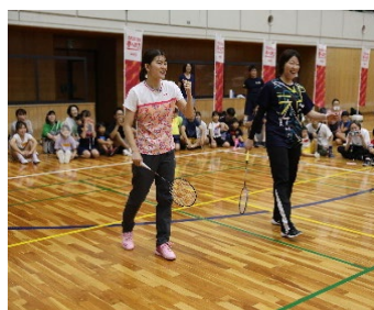
高槻市総合スポーツセンター (参加者310名)