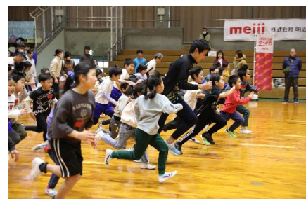
藤枝市民体育館 (参加者307名)