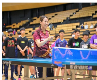
函館アリーナ (参加者210名)