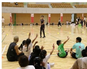
みづま総合体育館 (参加者200名)