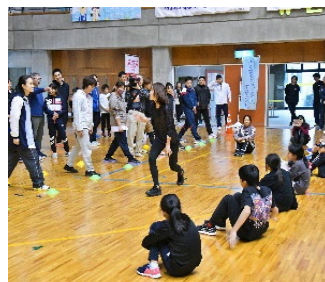
村山市民体育館 (参加者200名)